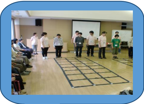
ふまねっと 運動 認知機能・運動機能に効果的